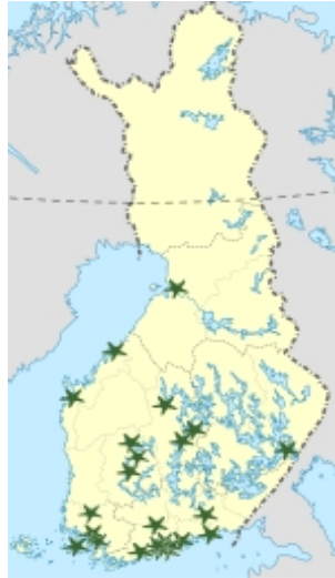
Suomessa on 25 luonto- ja ympäristökoulua