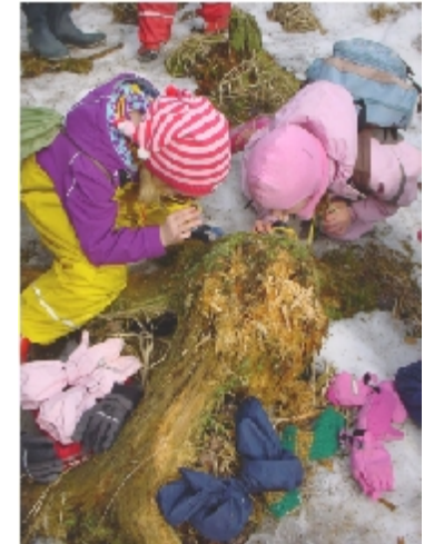
Luontokouluissa ekosysteemi tulee tutuksi.