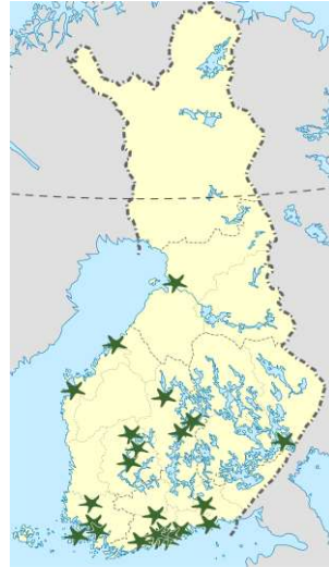
Suomessa on 25 luonto- ja ympäristökoulua