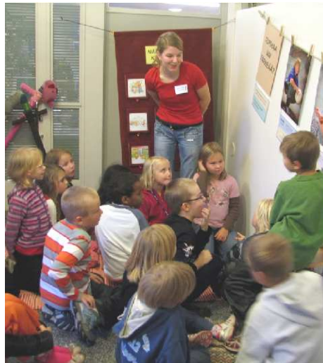
Ympäristökouluissa opitaan toiminnallisesti.