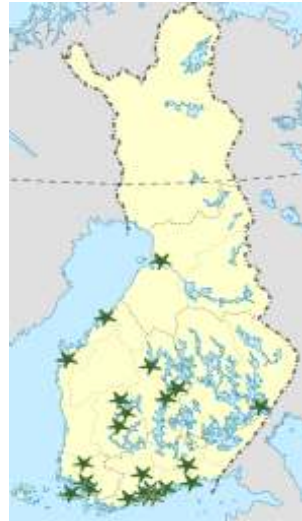
Suomessa on 25 luonto- ja ympäristökoulua