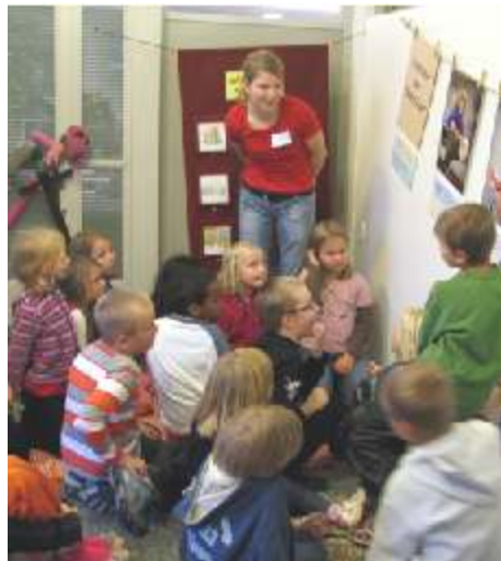
Ympäristökouluissa opitaan toiminnallisesti.