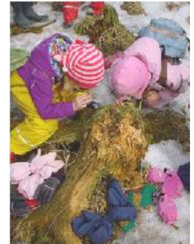
Luontokouluissa ekosysteemi tulee tutuksi.