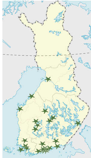
Suomessa on 25 luonto- ja ympäristökoulua