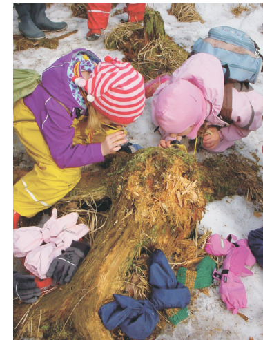
Luontokouluissa ekosysteemi tulee tutuksi.