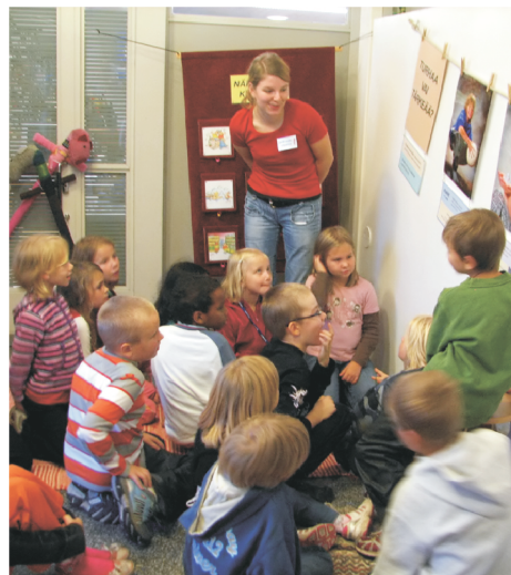
Ympäristökouluissa opitaan toiminnallisesti.