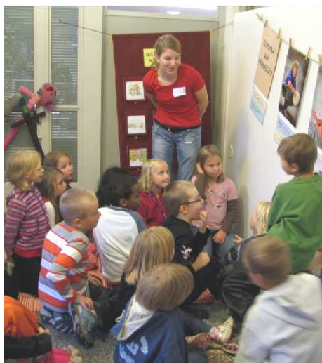
I miljöskolorna lär man sig genom att göra