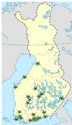
I Finland verkar 25 natur- och miljöskolor