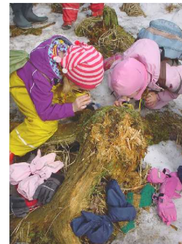
I naturskolan lär man sig om ekosystemen