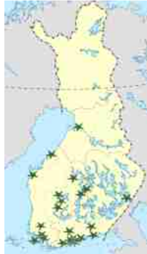
I Finland verkar 25 natur- och miljöskolor