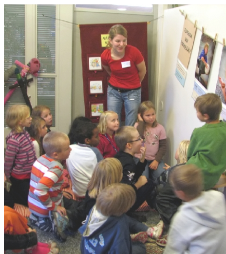
I miljöskolorna lär man sig genom att göra