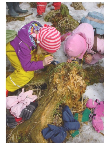
I naturskolan lär man sig om ekosystemen