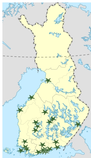
I Finland verkar 25 natur- och miljöskolor